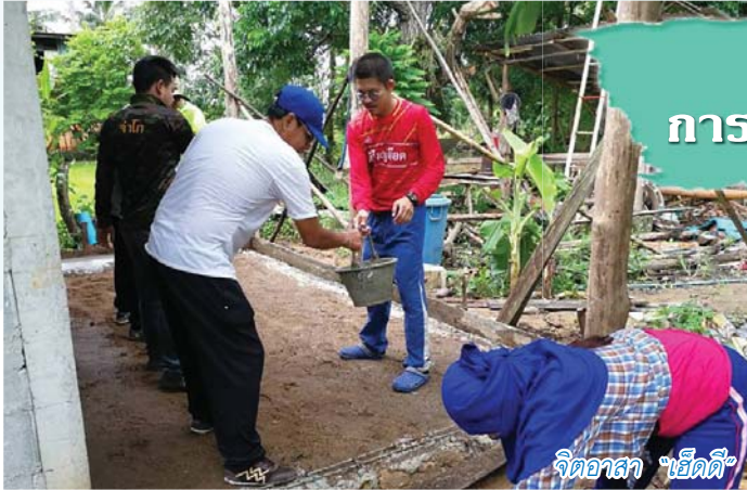
จิตอาสา "เฮ็ดดี"