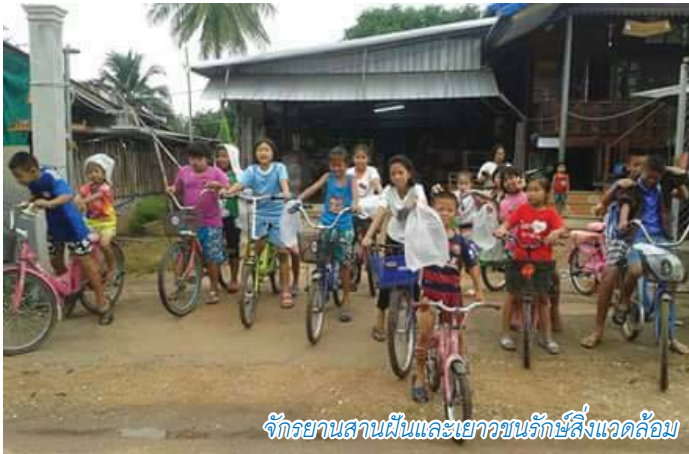
จักรยานสานฝันและเยาวชนรักษ์สิ่งแวดล้อม