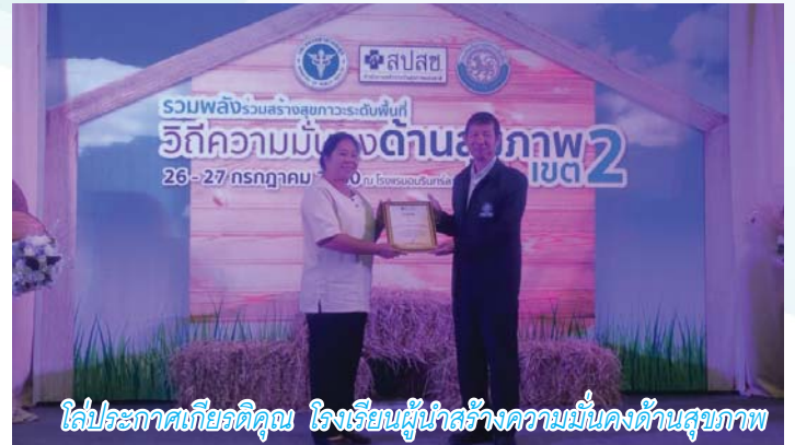
โล่ประกาศเกียรติคุณ โรงเรียนผู้นำสร้างความมั่นคงด้านสุขภาพ

- กิจกรรม อาสาเอ็ดดี เพื่อช่วยเหลือผู้ยากไร้ ผู้ด้อยโอกาส ผู้สูงอายุ และผู้พิการ ที่ไม่มีผู้ดูแล โดยการเข้าไปช่วยทำความสะอาดบ้านเรือน ซ่อมแซมบ้าน พุดคุยให้กำลังใจ และมอบเครื่องอุปโภค บริโภค เป็นการช่วยเหลือเบื้องต้น