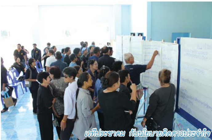
เวทีประชาคม กับนโยบายทิศทางประจำปี