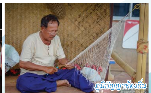
ภูมิปัญญาท้องถิ่น