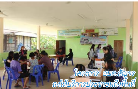
โครงการ อบต.สัญจร ลงให้บริการประชาชนถึงพื้นที่