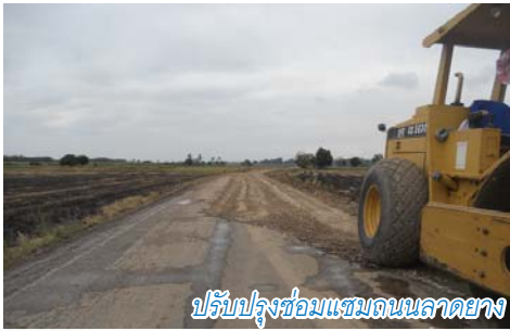
ปรับปรุงซ่อมแซมถนนลาดยาง