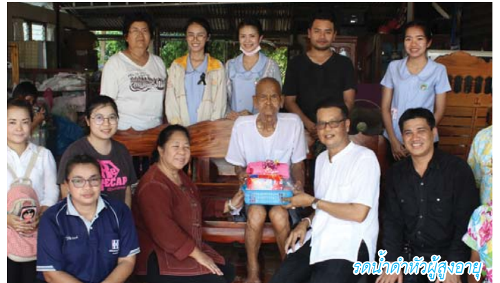
รดน้ำดำหัวผู้สูงอายุ