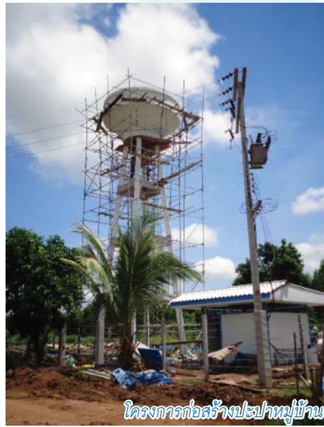
โครงการก่อสร้างประปาหมู่บ้าน