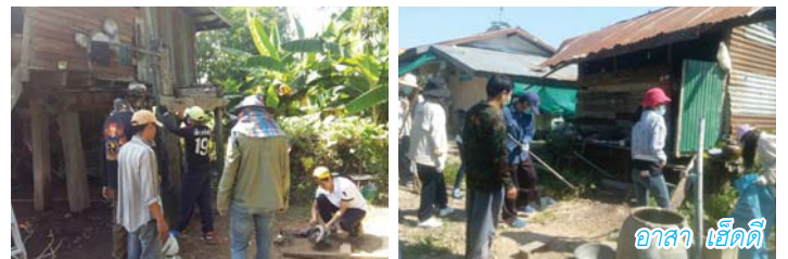
อาสา เอ็ดดี