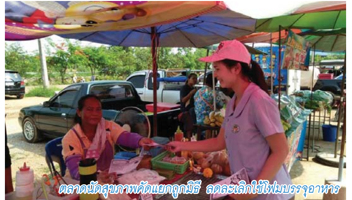
ตลาดนัดสุขภาพคัดแยกถูกวิธี ลดละเลิกใช้โฟมบรรจุอาหาร