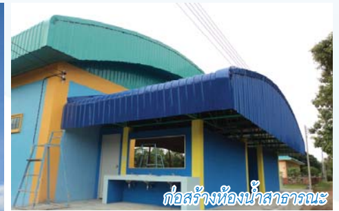
ก่อสร้างห้องน้ำสาธารณะ