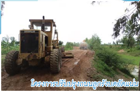
โครงการปรับปรุงถนนลูกรังบดอัดแน่น