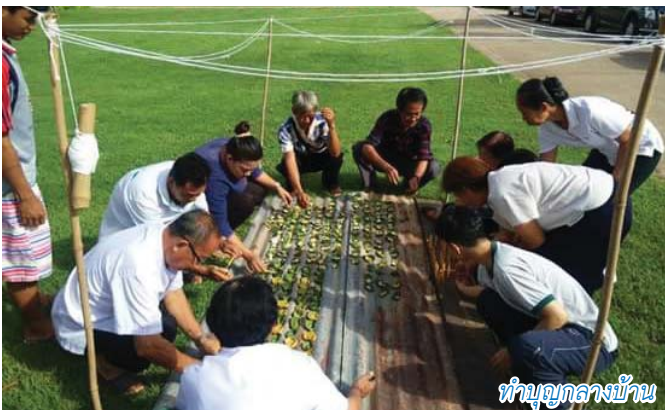
ทำบุญกลางบ้าน

การอนุรักษ์วัฒนธรรม ประเพณีของชุมชนตำบลหาดสองแคว ที่สืบทอดกันมาตั้งแต่สมัยบรรพบุรุษ เป็นสิ่งสำคัญ ดังนั้นองค์การบริหารส่วนตำบลหาดสองแควได้ส่งเสริมการจัดกิจกรรมทางศาสนา ประเพณีวัฒนธรรม การท่องเที่ยวและภูมิปัญญาท้องถิ่น เช่น การถวายเทียนจำนำพรรษา การตักบาตรหาบจังหัน การทำบุญกลางบ้าน งานประเพณีสงกรานต์ ประเพณีลอยกระทง งานถนนสายวัฒนธรรม ชุมชนลาวเวียงตำบลหาดสองแคว เป็นต้น สนับสนุนและปลูกจิตสำนึกรักบ้านเกิดให้กับเยาวชนตำบลหาดสองแควอีกด้วย.