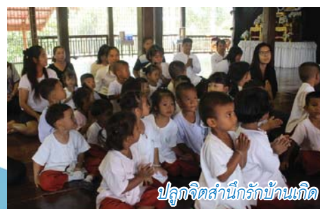
ปลูกจิตสำนึกรักบ้านเกิด