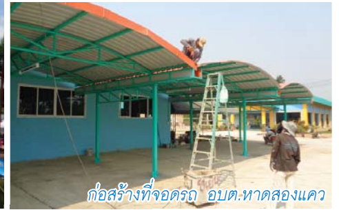
ก่อสร้างที่จอดรถ อบต.หาดสองแคว