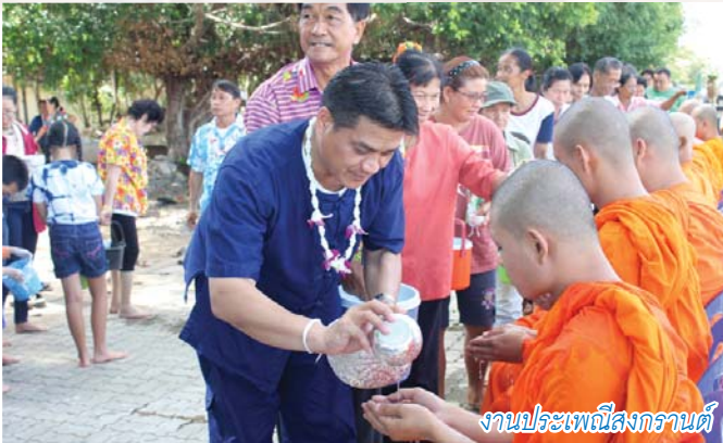
งานประเพณีสงกรานต์

การอนุรักษ์วัฒนธรรม ประเพณีของชุมชนตำบลหาดสองแคว ที่สืบทอดกันมาตั้งแต่สมัยบรรพบุรุษ เป็นสิ่งสำคัญ ดังนั้นองค์การบริหารส่วนตำบลหาดสองแควได้ส่งเสริมการจัดกิจกรรมทางศาสนา ประเพณีวัฒนธรรม การท่องเที่ยวและภูมิปัญญาท้องถิ่น เช่น การถวายเทียนจำนำพรรษา การตักบาตรหาบจังหัน การทำบุญกลางบ้าน งานประเพณีสงกรานต์ ประเพณีลอยกระทง งานถนนสายวัฒนธรรม ชุมชนลาวเวียงตำบลหาดสองแคว เป็นต้น สนับสนุนและปลูกจิตสำนึกรักบ้านเกิดให้กับเยาวชนตำบลหาดสองแควอีกด้วย.