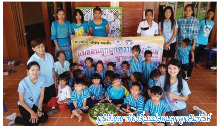
ภูมิปัญญาท้องถิ่นแม่สอนลูกผูกสัมพันธ์